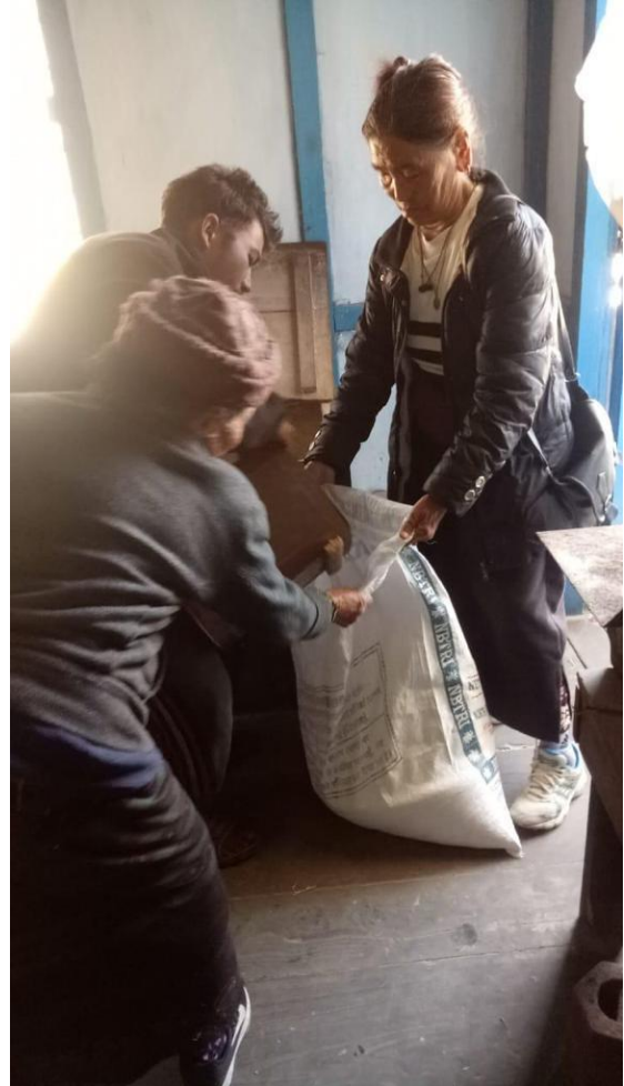
Devant le magasin du monastère (le seul du village), distribution alimentaire et un peu d'argent : 1000 roupies soit 11€ pour les 22 familles nécessiteuses (par semestre).